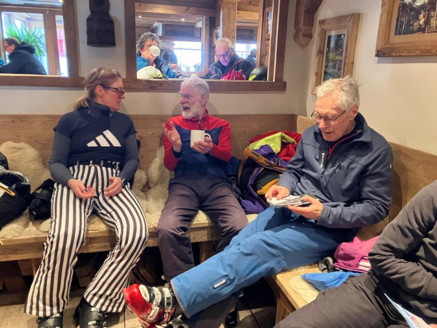
Het weer is aanvankelijk niet erg geweldig.