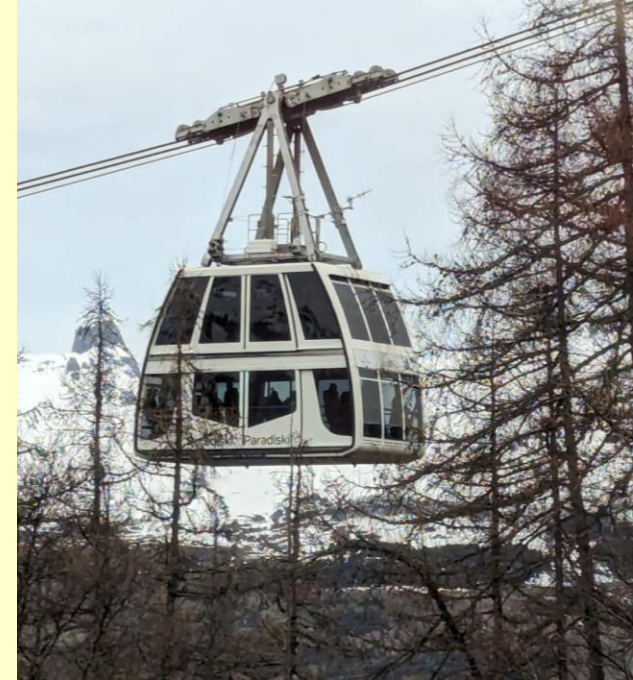
De Vanoise Express, met tegen de helling Peisey en erboven Valandry.