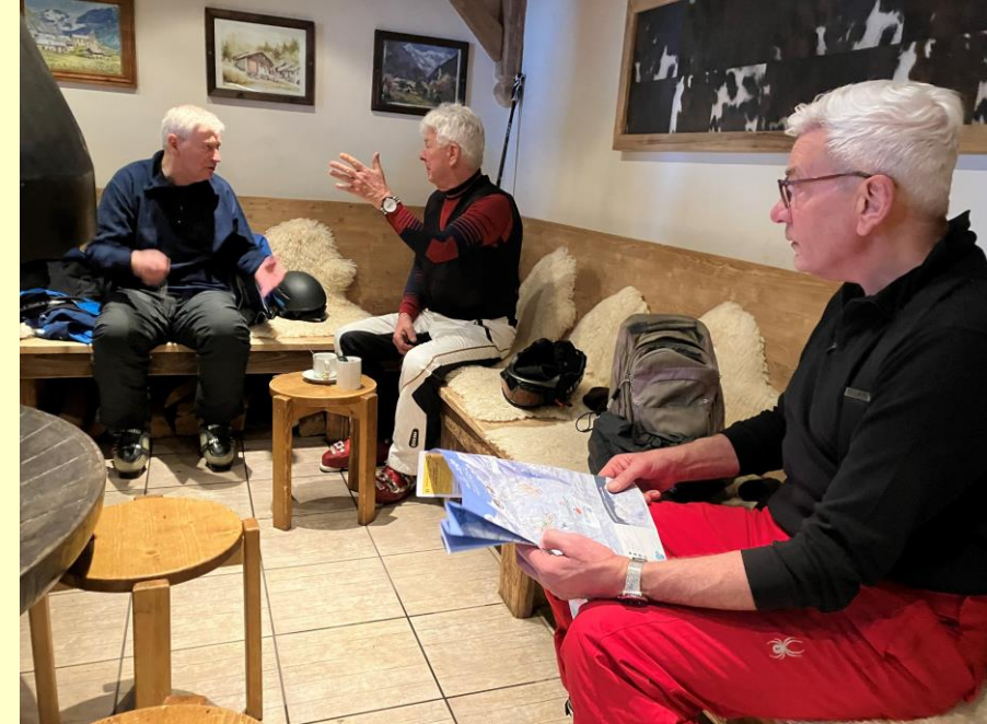
Dit gold zeker ook voor de lager gelegen pistes.